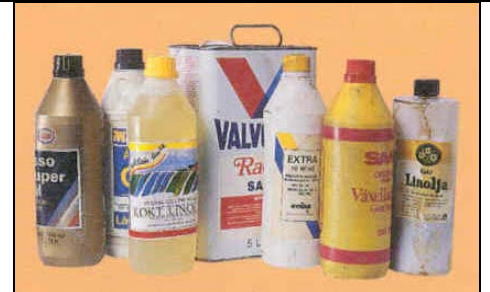
Olyada-Baaruunta & Biraha waxaa ku jira maaddooyin dhaliya kansar iyo maaddooyin kale oo sun ah.