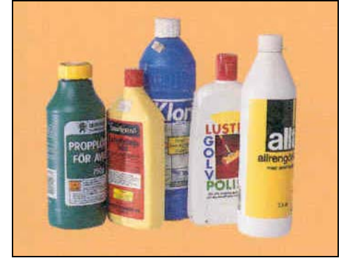
Maaddooyinka-Nadaafadda waa inaan la raacinin bacda-qashinka ama biyaha musqulaha.

S awirada soo socda waxa ay ku tusinayaan qashimada sunta ah ee guryaha ka soo baxi kara kuwaas oo halis ku ah noloshu dadka, xayawaanka iyo degaanka dabiiciga ah, haddii aanan si habboon loo xanaaney.